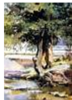
Öreg fa a vízparton /30x40 cm, tempera, karton/