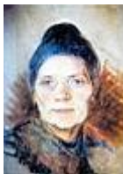
Krétarajz édesanyjáról /27,5x38,5, pasztellkréta, papír/