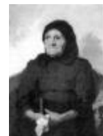
Édesanyja arcképe (olajfestmény)