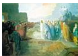
Jézus csodatétele /100x70 cm, olaj, vászon/