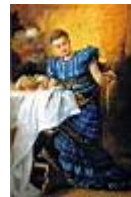
Hímző lány /40x60 cm, rétegelt lemez, olaj/