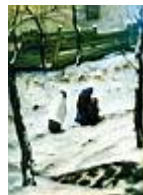
Téli utcarészlet /50x70 cm, olaj, karton/