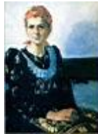
Matyó menyecske fejkendőben /60x80 cm, olaj, vászon/