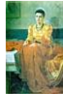
Matyó lány piros kendővel /95x143 cm, olaj, vászon/