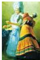
Menyasszonyöltöztetés /120x170 cm, olaj, vászon/