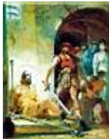
Keresztelő Szent János a tömlőcében /18x22 cm, tempera, karton/