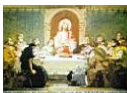
Az utolsó vacsora (színvázlat) /30x22 cm, tempera, papír/