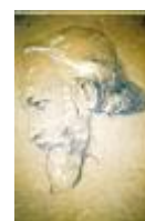
Fejtanulmány /19x27 cm, ceruza, fedőfesték, karton/