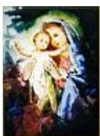
Madonna (színvázlat) /14,5x10,5 cm, akvarell, tempera, papír/